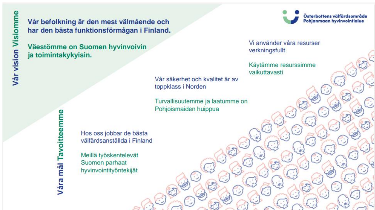
Bild 1. Österbottens välfärdsområdes strategi.

Välfärdsområdets fullmäktige har 12.9.2022 godkänt den första strategin för välfärdsområdet med följande vision: "Vår befolkning är den mest välmående och med bästa funktionsförmågan i Finland." Vårt mål är att säkerheten i och kvaliteten på våra tjänster är av toppklass i Norden och att vi har de bästa välfärdsanställda i Finland och använder våra resurser verkningsfullt.