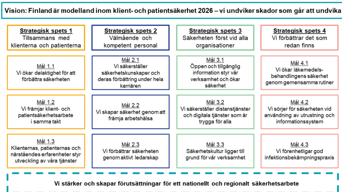
Bild 4. Klient- och patientsäkerhetsstrategi och genomförandeplan 2022–2026 (SHM 2022).

I planerandet och genomförandet av tillsynsarbetet beaktas även Social- och hälsovårdsministeriets Klient- och patientsäkerhetsstrategi och genomförandeplan som upprättats för åren 2022– 2026.